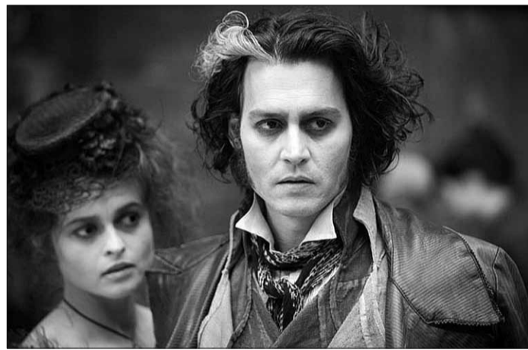
„Svynis Todas: demoniškas Flyto gatvės kirpėjas“

Jei teisingai supratau LTV anonsą, šią vasarą LTV2 primins niekad nenusibostančią Gruzijos kino klasiką. Pirmasis ciklo filmas – Merabo