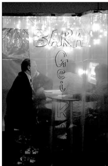
Makoto Aida. „Gei-Ko baras“