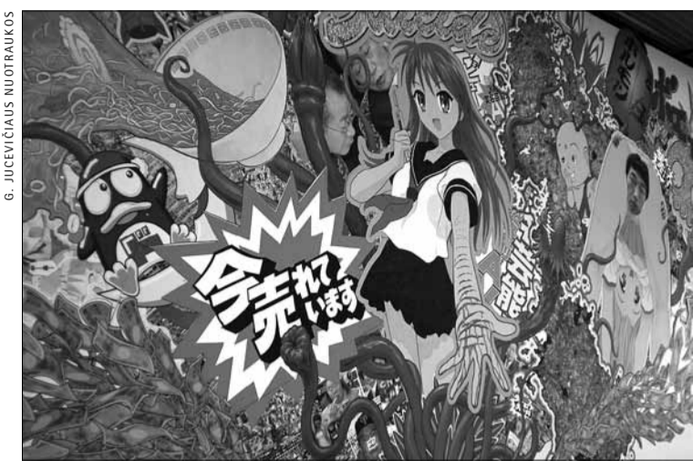
Makoto Aida. Kūrinio „Paminklas Niekui III“ fragmentas. 2009 m.

Kita vertus, Aida refleksijos savo kultūros atžvilgiu tokios pat kritiškos. Vartotojiškumas, globalizacija, absurdas, spektaklio visuomenė. Atrodo, kad jis išverčia tiek Vakarų, tiek savo kultūros kailį į „blogąją“ pusę ir rodo jo abejotinę būklę. O šis gestas labai