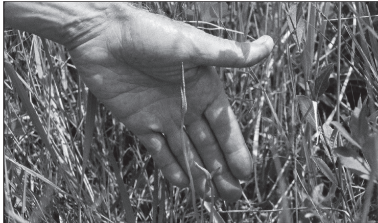
„Septyni pasivaikščiėjimai su Marku Brownu“

Filmą sudaro dvi viena nuo kitos neatsiejamos, bet kartu radikaliai skirtingos formos dalys – pasivaikščiėjimų dokumentacija ir 16 mm kamera filmuotas herbariumas. Toks sumanymas atsirado