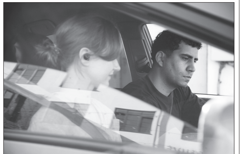
Akimirka iš performatyvos kelionės „Taxi Vilnius“

Vienas įdomiausių „Taxi Vilnius“ aspektų – tai, kad Vilniaus kaip romantiško, poetiško miesto vaizdavimas ir migrantų kasdienybės jame temos nesipeša tarpusavyje. Vilniaus legenda nesumenksta, jeigu jį mums aprodo indas ar egiptietis; važiuoti gatvėmis ir žvalgytis į miesto vaizdus netampa mažiau žavu, net jei