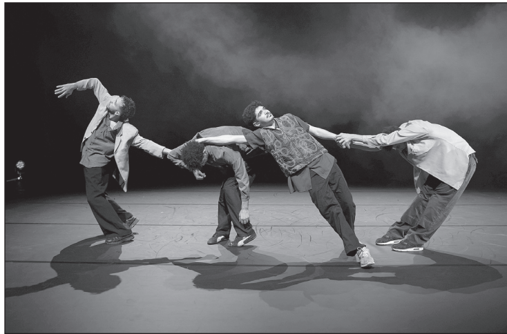
Scena iš šokio spektaklio „HIT 7AYT“

Pagrindinis spektaklio choreografijos motyvas – pasisveikinimai ir kiti kasdieniai gestai, būdingi Maroko kultūrai. Jie į bendrą judesį įsipina kaip atsikartojantys elementai ir tampa vienintele atskiras spektaklio scenas saistančia gija. Kai kurie gestai pažįstami iki kaulų smegenų, kiti – verčiantys smalsauti ir spėlioti. Juose