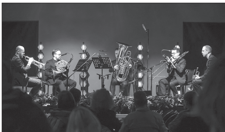
„Helsinki brass quintet“