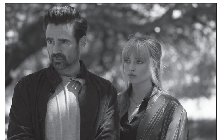
„Didelė drąsi graži kelionė“

Siužetas rutuliojasi tarsi pagal savipagalbos literatūrą: kiekvienos durys – nauja stotelė, joje laukia tvarkingai sustatyta diorama iš praeities. Deividas sugrįžta į