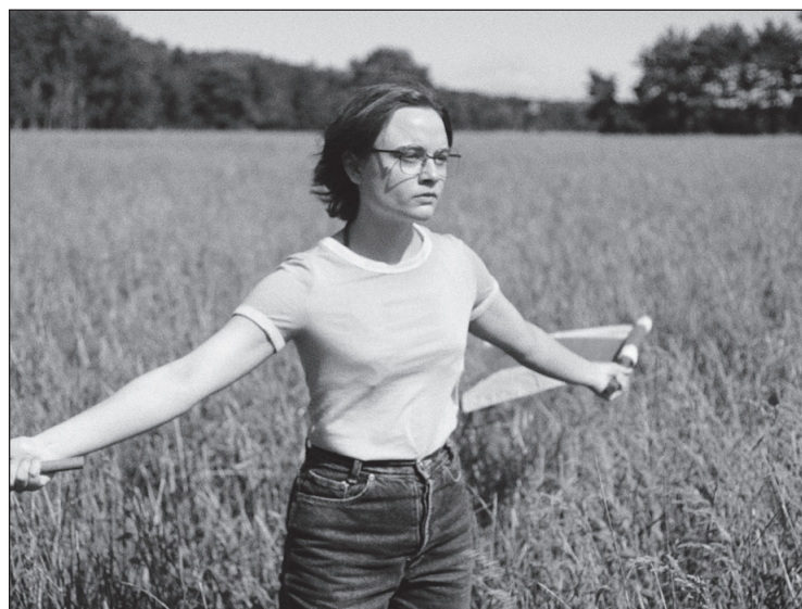
„Žvelgiant į saulę“

yra stipriai orientuotas į septynerių metų mergaitės, kuri stebi ir bando suprasti savo tėvų skyrybas bei susitaikymą, perspektyvą. Kuo jus domina vaiko požiūris?