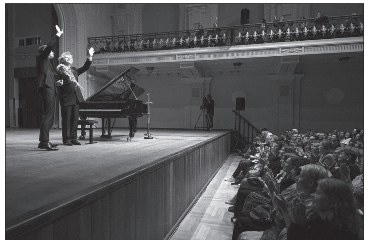
Koncerto Čiurlioniu akimirka

Tai jau penktasis svečias, angažavęs lyg ir naujai improvizuotam, nebūtam „Pokalbiui“ su proseneliu.