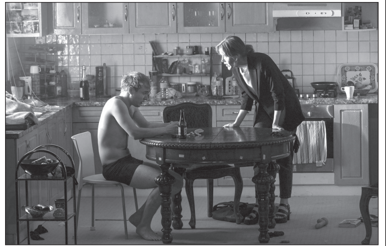
Scena iš spektaklio „Parallax“

Peteris Morganas – britų scenaristas ir dramaturgas, savo kūriniuose su pasimėgavimu nulupantis istorijai odą: nuo serialo „The Crown“ karališkosios šeimos iki „Frost/Nixon“ prisipažinimo, kuris sužlugdė prezidentą. „Patriots“ jis parašė karo metu – pjesės premjera 2022 m. balandžio 9 d. Londone skambėjo jau sprogstant bomboms Ukrainoje. Talentingas dramaturgas parašė raudonesnę už kraują kroniką: