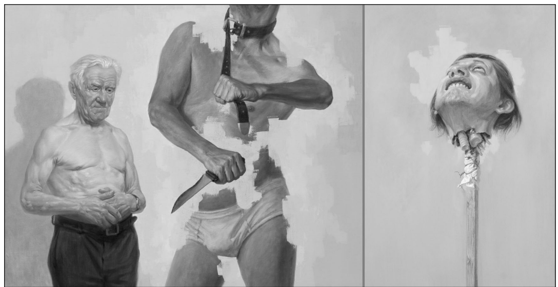
Žygimantas Augustinas. „Jie nusipjaudavo sau galvas“. 2012 m.