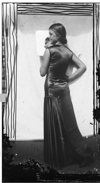
„Vakarinė suknelė“, 1930 m.