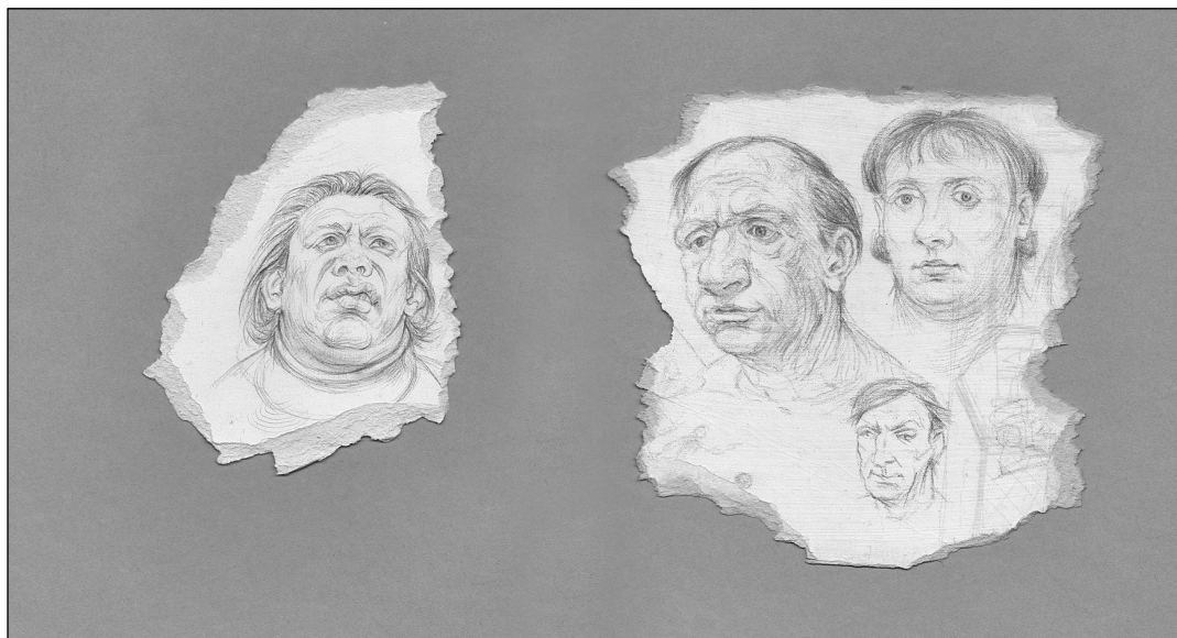
Žygimantas Augustinas. „Paveikslėliai būdavo išsaugomi“. 2010–2011 m.

Visi jo vaizduojami kūnai turi barokiškai pritvinkusio mėsingumo. Toji mėsa atrodo maudžianti, skaudanti, su netolygiomis kraujagyslėmis ir išpurtusiais audiniais. Ji la-