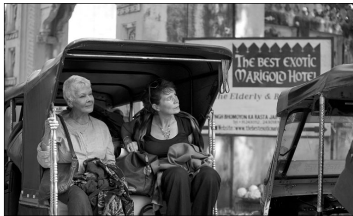
„Geriausias egzotiškas „Marigold“ viešbutis“