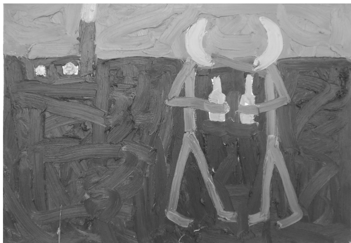
Alonas Štelmanas. „Kraujo broliai I“. 2011 m.

kompozicija, gėla, kartėlis, baimė, sumišimas. Ji sukelia daug emocijų – nuo pasidarymo iki kreivos šypsenos – ir ilgai neužsimiršta.