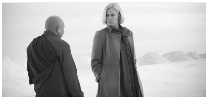
„Miegančių drugelių tvirtovė“

„Laikiniai“ (rež. Jūratė Samulionytė, prodiuserės Jurga Gluskinienė, Giedrė Beinoriūtė, „Monoklis“) „Draudžiami jausmai“ (režisierius ir prodiuseris Deimantas Narkevičius) „Dešimt priežasčių“ (rež. An-