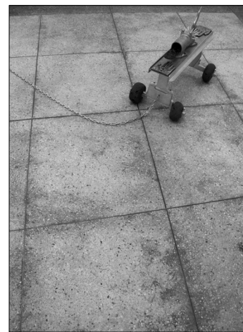
Romualdas Inčirauskas. „Apreiškimo žvėris“. 2010 m.

kelios tekstilinė, o nėra nė vieno keraminio objekto? Kodėl nedalyvauja žymiausi Lietuvos skulptoriai? M. Zavadskis, pripažindamas, kad