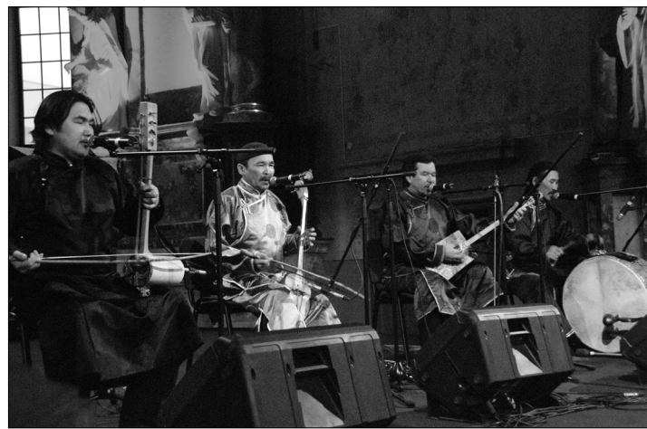
„Hunn Hurr Tu“

Apie Tuvos tradicinę ir apskritai kultūrą nedaug ką rasi net ir visai žinančiame internete, tačiau anksčiau