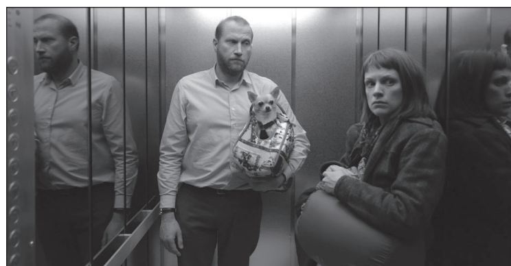
„Naujienos iš Marso planetos“