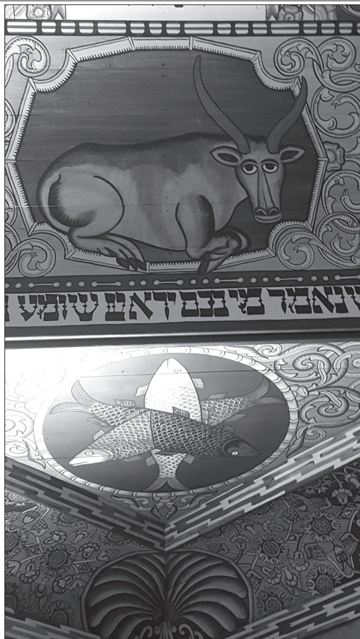
Gwóźdźecio sinagogos polichrominių lubų rekonstrukcijos fragmentas