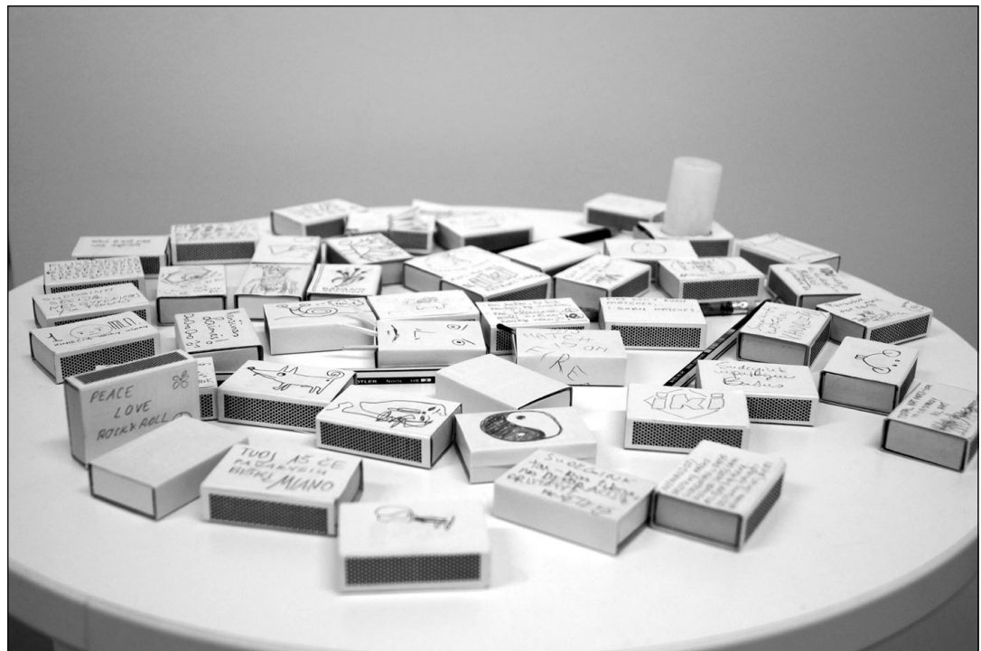
Lankytojų piešiniai ant „IKI“ degtukų dėžučių

sidžiaugiau, kad dalyvavimo išvengiau slėpdamasi už fotoaparato), vėliau vyko popierinių lėktuvėlių laidymo varžybos, mini stalo futbolas su šiaudeliais, „palengvintas“ šachmatų su kvapais turnyras (kuratorės nepirko daržovių, o į vienkartinės stiklainaites įbėrė įvairių prieskonių), vidaus ir lauko krepšinis su stalo teniso raketėmis, lenktynės su ilgais kartono lakštais, priklijuotais prie pėdų... Išsiskyrė baliono stūmimas, kurio laimėtoju paskelbtas mažiausiai pastūmęs balioną (aišku, rungties dalyviai tai sužinojo tik įvykdę užduotį). Olimpiadą užbaigė Fluxus himnas visiems dalyviams vienu metu giedant pasirinktas dainas, ir prizų įteikimo ceremonija. Vis dar nežinau, kaip