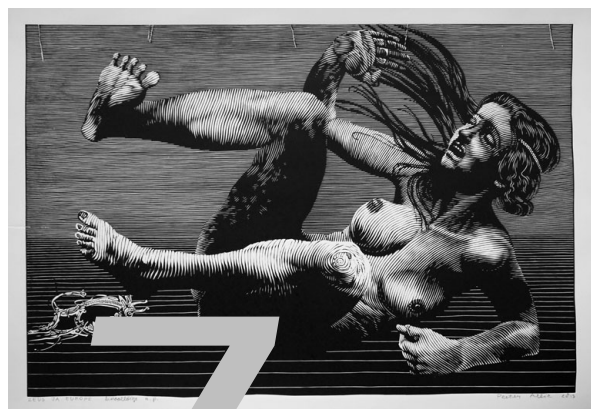
Peeter Allik, „Dzeusas ir Elena“ 2013 m.