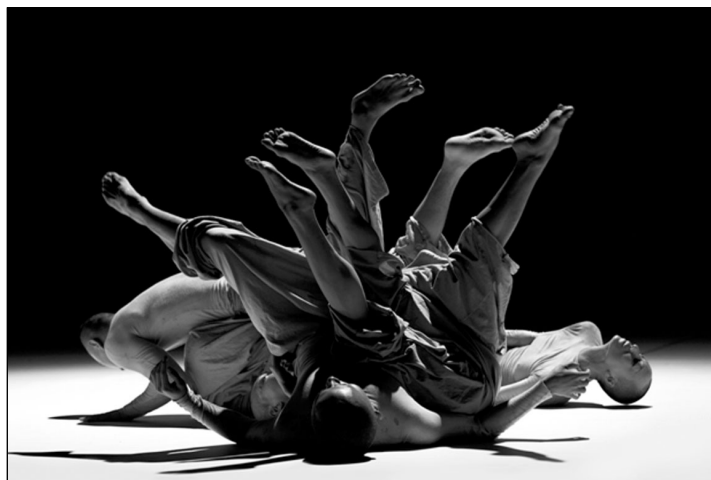
TAO šokio teatras

Gegužės 10 d. savo lyderio, išskirtinės Suomijos ir Šiaurės šokio as-