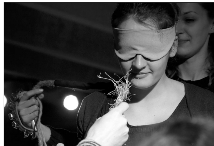
„Akmuo vanduo geluonis“

sakotų apie savo veikiausiai ne ką lengvesnę pradžią. Vis dėlto, užsivėrimas tame pačiame rate, kuriame jau viskas daug kartų iškalbėta, sunkiai gimsta naujos idėjos. O kalbėjimas dėl kalbėjimo, kad ir patiems